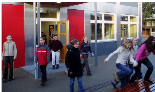
Fremdsprachenhaus am Gymnasium Farmsen

In einer zusammenwachsenden Welt wird es im privaten wie im universitären und beruflichen Bereich zunehmend wichtiger, über umfangreiche und sichere Fremdsprachenkenntnisse zu verfügen. Der englischen Sprache kommt hier als der wichtigsten internationalen Verkehrssprache eine herausragende Bedeutung zu. Bilingualer Unterricht stellt nachweislich eine der effektivsten Methoden dar, um sich eine Fremdsprache umfassend anzueignen. Die Schülerinnen und Schüler verwenden Englisch ganz selbstverständlich, um Fachinhalte zu verstehen und zu bearbeiten – und das bereitet Spaß und Freude. Schon nach wenigen Monaten lassen sich deutliche Lernfortschritte feststellen.